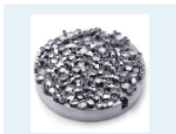
Coroane dentare (CoCrMoW)

Fabricarea in masa a structurilor dentare, precum punti si coroane dentare.