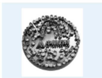
Coroane dentare (NiCr)