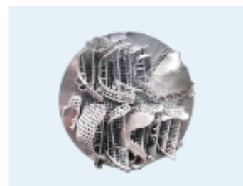
Structuri ( CoCrMo )